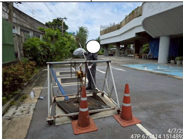
บ่อบำบัดน้ำทิ้งก่อนระบายออกสู่ท่อระบายน้ำสาธารณะ