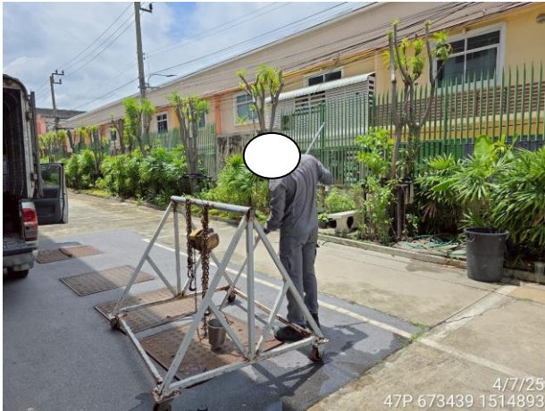
จุดระบายน้ำเสียจากระบบบำบัดทิ้งที่ออกจาก ส่วนตกตะกอน ชุดที่ 2